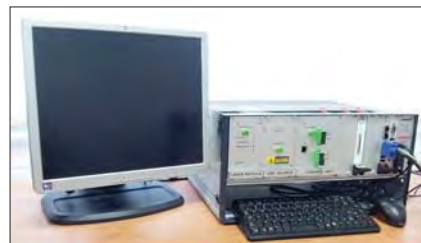
Řídicí a vyhodnocovací jednotka senzorového systému

mřížkách. Výsledné parametry měření, jako jsou citlivost či přesnost určují návrhové a výrobní parametry vláknových mřížek samotných a parametry detekční elektroniky. Umístěním více mřížek v optickém vlákne je možné monitorovat měřenou veličinu lokálně i distribuovaně v mnoha zvolených místech.