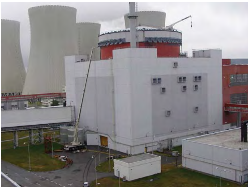
Pohled na jeden z kontejnmentů JE Temelín

Jedním ze způsobů aktuálního monitorování tvarových změn konstrukce je metoda, kdy se k měření využívají dva v betonu zabudované měřicí systémy na principu strunových tenzometrů. Získaná data jsou pak využívána projektantem k hodnocení stavu ochranné obálky - kontejnmentu. Data z uvedených systémů nemají charakter limitních hodnot